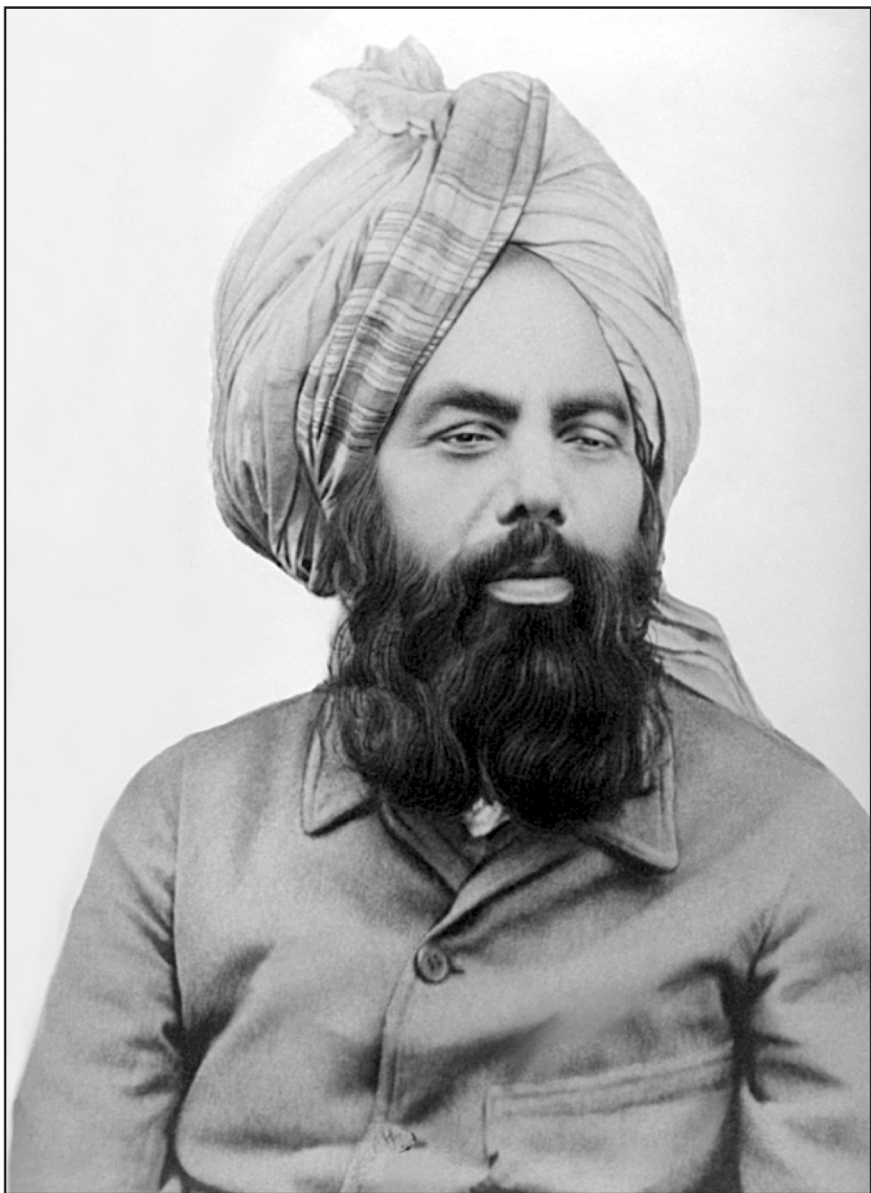
حضرت مرزا غلام احمد دایانی سیح موعود و مهدی موعود علیہ السلام